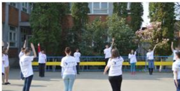
Figura. 4.3 – Recapitulare - reprezentarea graficelor de funcții elementare

4.7. Inteligența interpersonală. Inteligența interpersonală reprezintă capacitatea de a sesiza și de a evalua cu rapiditate stările, intențiile, motivațiile și sentimentele celorlalți. Aceasta include sesizarea expresiei faciale, a inflexiunilor vocii, a gesturilor, include și capacitatea de a distinge între diferite tipuri de relații interpersonale și capacitatea de a reacționa eficient la situațiile respective. Elevii cu acest tip de inteligență comunică în mod eficient și empatizează cu ușurință cu alții, ei pot fi lideri. Ei au capacitatea de a interpreta și de a răspunde la stările, emoțiile, motivațiile și acțiunile altora, precum și