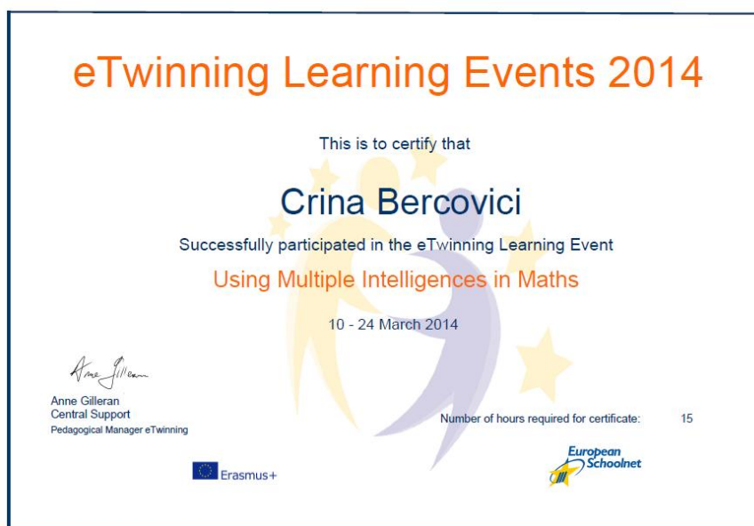
Figura. 1.1 – Certificat obținut în urma absolvirii evenimentului de învățare (LE)

dezvoltării lui spre maturitate. Societatea este aceea care ar trebui să stimuleze performanța tinerilor, să respecte adevăratele valori. Elevii de azi au avantajul acestei ere a informațiilor. Cu un pic mai multă autodisciplină, cu un echilibru între independența economică și cultura generală motivați fiind ca vechile generații: notă, bursă, experiență nouă de cunoaștere, răsplata unui cadou din partea părinților etc, au șansa reușitei în viață. Temelia carierei, vieții tânărului de azi, adultului de mâine se pune pe băncile școlii. La ea contribuim și noi, dascălii, de aceea, observând că „ elevii nu conștientizează suficient că au în față un examen ”, este bine să ajutăm elevii să se cunoască, să beneficieze de informații sub diferite forme, cât mai apropiate de stilul lor de învățare.