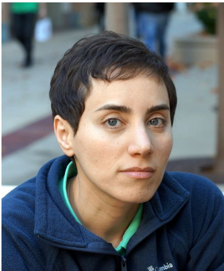
Figura. 3.1 – Maryam Mirzakhani (1977 - 2017)

din 1994 (Hong Kong) și la OIM din 1995 (Toronto), unde a fost prima dintre elevii iranieni care a terminat cu un scor perfect. A obținut diploma de licență în matematică (1999) la Universitatea de Tehnologie Sharif din Teheran. A urmat studiile postuniversitare în Statele Unite, obținând doctoratul la Universitatea Harvard (2004), unde a lucrat sub supravegherea premiantului Fields Curtis McMullen. Ea a fost, din 2004, cercetătoare la Institutul de Matematică Clay și profesoară la Universitatea Princeton. În 2009, a devenit profesoară la Universitatea Stanford.